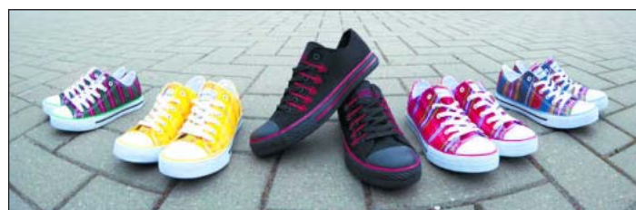
Vasemmalta: vihreä-violetit tossut viittaavat länsivirolaiseen Ristin kuntaan, keltaiset Muhun saareen, mustat punakirjailut Mulgimaan, punaiset Pärnuun ja kirjavat etelävirolaiseen Harglan kylään.

taavat Mulgimaan, joka sijaitsee Viljandin seudulla. Raikkaan punaiset tennarit sinivihreillä raidoilla vievät ajatukset Pärnuun.