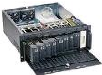
Illustration 1: Накопитель HDD GHR-422-25