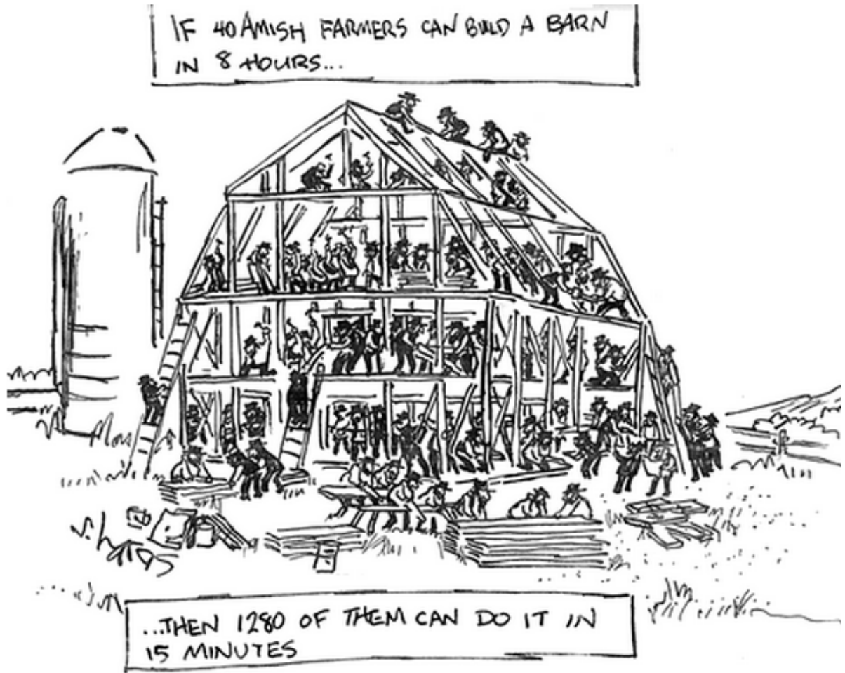
Sidney Harrise karikatuur