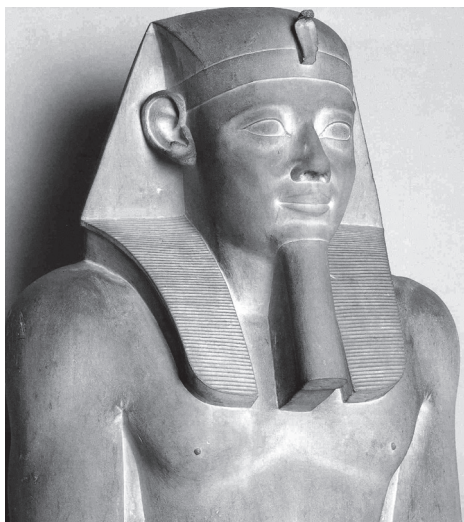
Senusert I istuv kuju (detail). 12. dünastia, u 1930 eKr. Lubjakivi, kõrgus 200 cm. Egiptuse Muuseum (Kairo)

endale jutustada mitmesuguseid imelugusid (omapärane araabia „Tuhande ja ühe öö muinasjuttude“ kauge ettekuulutaja). Keskmise riigi aegse 12. dünastia asutaja Amenemhet I (u 1991–1962 eKr), olles kogenud õukondlaste reeturlikkust, on oma õpetuses pojale Senusert I-le (valitses u 1971–1926 eKr) oma alamate suhtes puhtinimlikult pessimistlik, ebausaldav, kahtlev ning ettevaatlik.